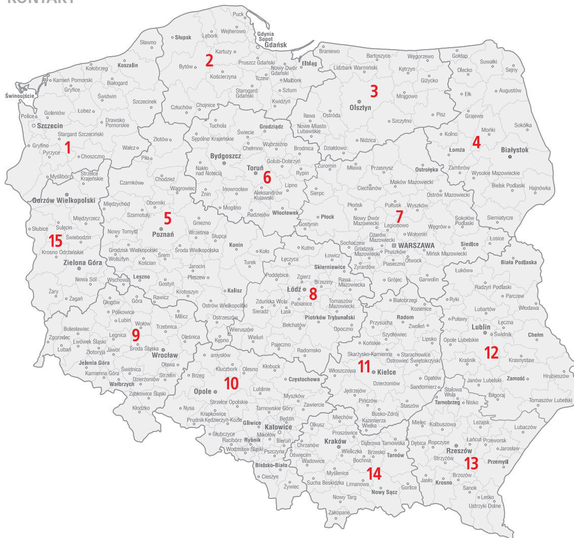
Telefony Regionalnych Przedstawicieli Handlowych oraz Doradców Techniczno-Handlowych