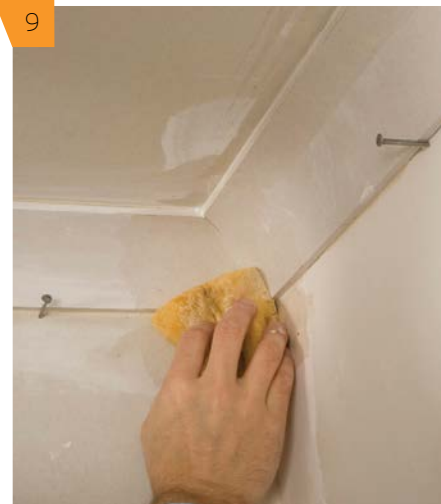
9 Wilgotną gąbką przecieramy górne i dolne krawędzie gzymsu aby usunąć wszelkie pozostałości kleju.