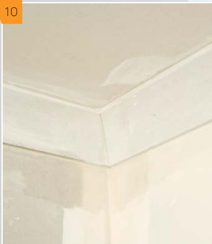
10 Po wyschnięciu kleju wyciągamy gwoździe podtrzymujące gzymsy.