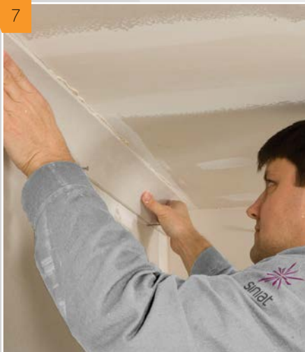
7 Przykładamy gzyms z klejem opierając go na wytaczających poziom gwoździach.