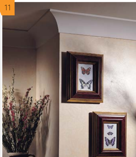
11 Naroża wykończone za pomocą gzymsów zwiększają estetykę pomieszczenia.