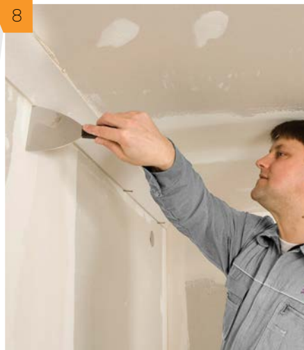
8 Nadmiar wyływającego kleju usuwamy szpachelką.