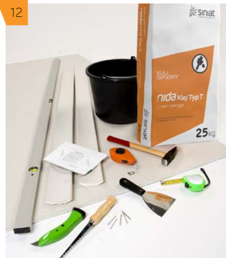
12 Gwarantujemy uzyskanie wysokiej jakości wykończenia przy zastosowaniu elementów systemu NIDA.