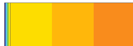
z zastosowaniem POROFIX nadproże